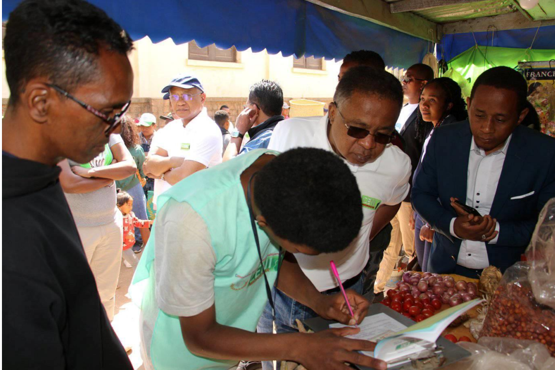
Photo 1 : Supervision des activités de la Refonte totale des listes électorales et du registre électoral national dans la Commune d'Ankaraobato ANTANANARIVO ATSIMONDRANO le 22 octobre 2022 par Monsieur Le Président de la CENI.