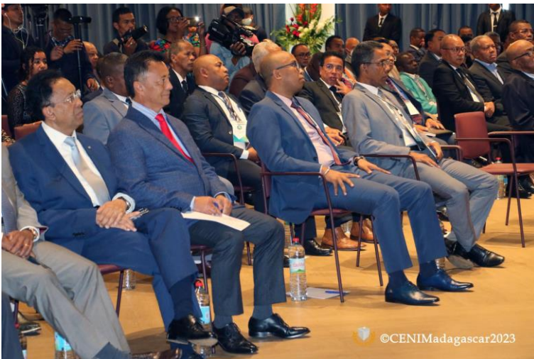
Photo 3: 1 er Dialogue national avec les parties prenantes aux élections sur « La fiabilité et la transparence du Processus électoral » le 24 mars 2023 au Novotel ANTANANARIVO (à gauche) ; et 3 ème Dialogue national pour une « Réunion d'échanges et d'information sur le déroulement du processus électoral » le 27 juillet 2023 à l'hôtel Radisson Blu Ambodivona (à droite).